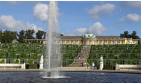
Potsdam, Schloss Sanssouci