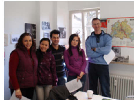
Im Orientierungskurs (BAMF 17)